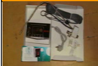
Панель контроля пассивной